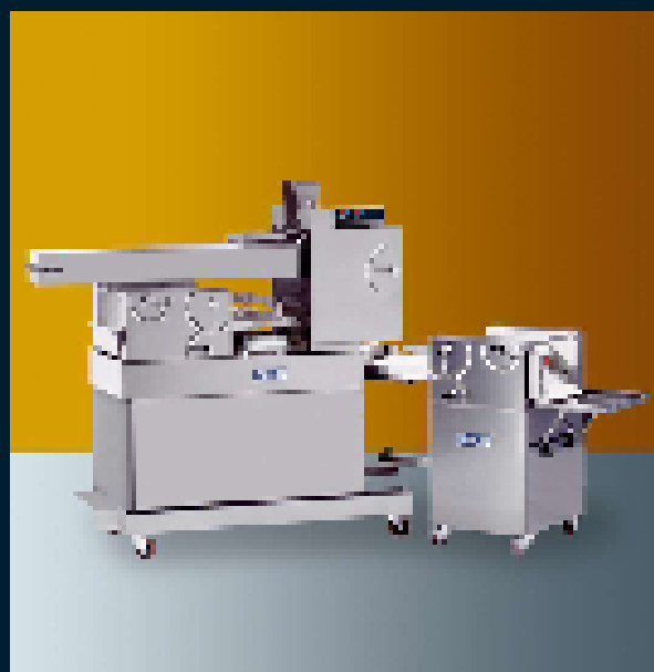
2 rows table - 2 sides - 20kg