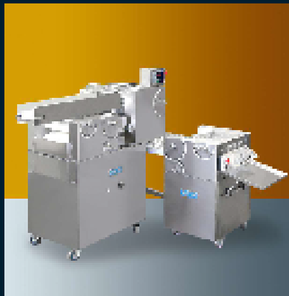
1 row table - 1 side - 10kg