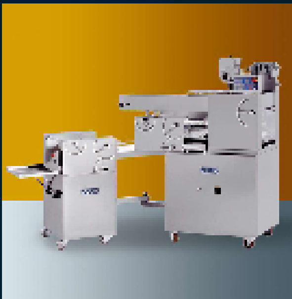
1 row table - 1 side - 10kg