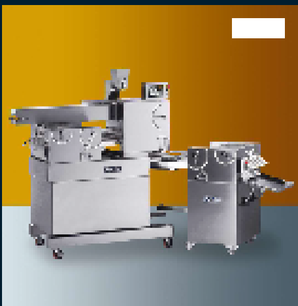
1 row table - 1 side - 10kg